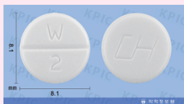
흰색정제 : 2mg