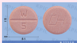
분홍색(살구색)정제 : 5mg