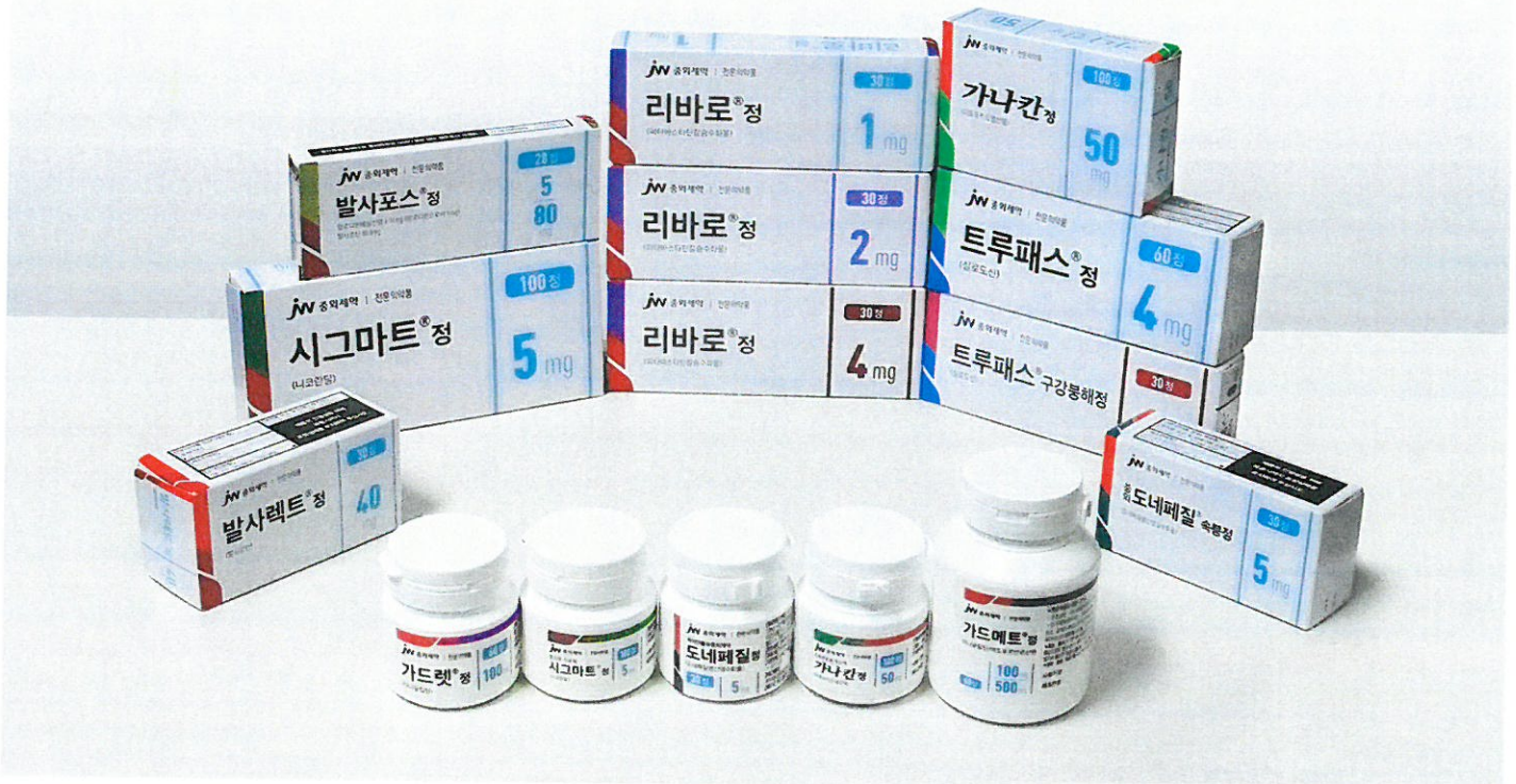
<새롭게 변경된 2021 JW ETC 표시자재 디자인 모습>

6. 당사는 사용자(고객) 관점에서 끊임없이 디자인 전략을 강구하며 대한약사회와 함께 개선책을 강구하고 있습니다. 기존 리뉴얼된 디자인에 익숙한 상황에서 새롭게 업데이트됨에 따라 다소 불편해 하실 수 있지만 일정 적응 기간을 가진다면 잘 해결 될 수 있는 문제라고 사료됩니다.