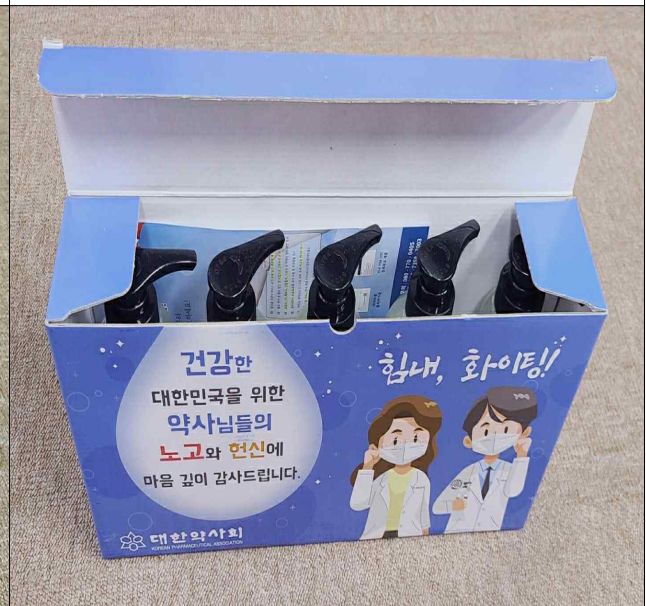
손소독제 박스 구성품목 (손소독제 500ml× 5개)